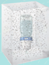
PRUEBA DE LA INTEGRIDAD DEL FILTRO Y SISTEMA DE VENTILACIÓN