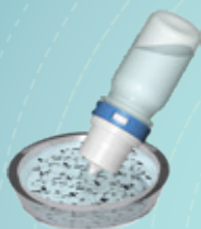
PRUEBA DE INTEGRIDAD DEL SELLO DE LA PUNTA DEL DISPOSITIVO.

DISEÑADO PARA PRESENTACIONES LIBRES DE PRESERVANTES EVALUADO CON PRUEBAS EN AMBIENTES MICROBIOLÓGICAMENTE DESAFIANTES